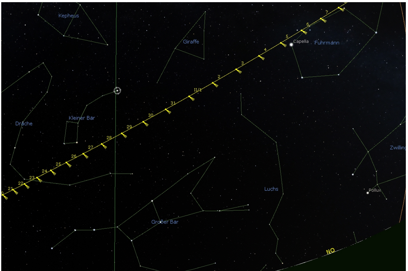
C/2022 E3 (ZTF) vom 20. Januar bis 8. Februar (Grafik: Stellarium )

Kometen C/2022 E3 (ZTF) zieht mit zunehmender Helligkeit ( 8^{\text{mag}} bis 5.5^{\text{mag}} ) von der nördlichen Krone über den kleinen Bären hin zum Stier. Im Fernglas sollte er ab etwa 19 Uhr im Norden und später im Nordosten beobachtet werden können.